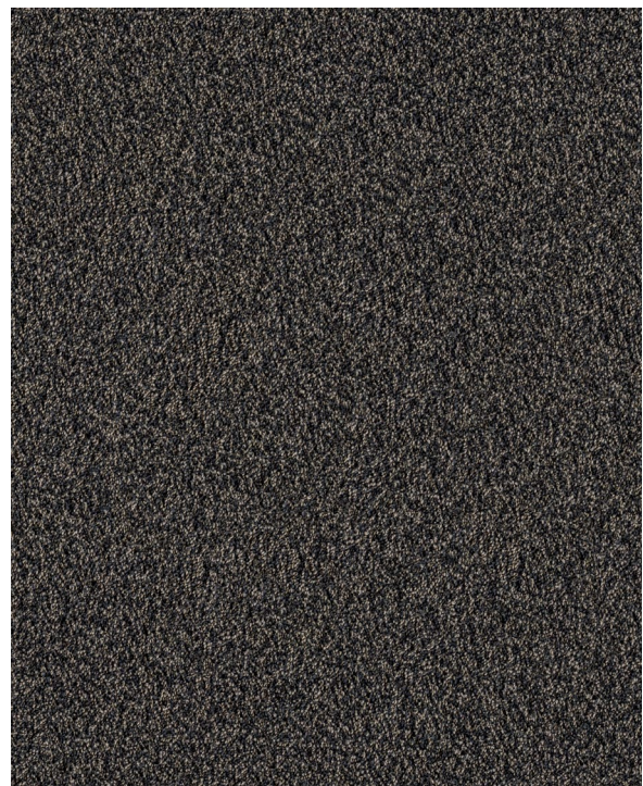
NEULAND HELIX DU00