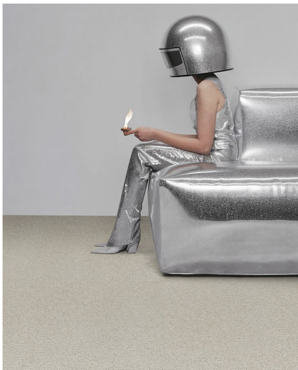
NEULAND PARADOX DU00