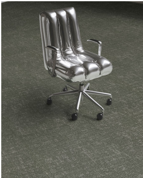
NEULAND FLUXDU 00