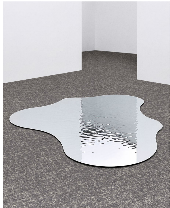
NEULAND MATRIX DU00