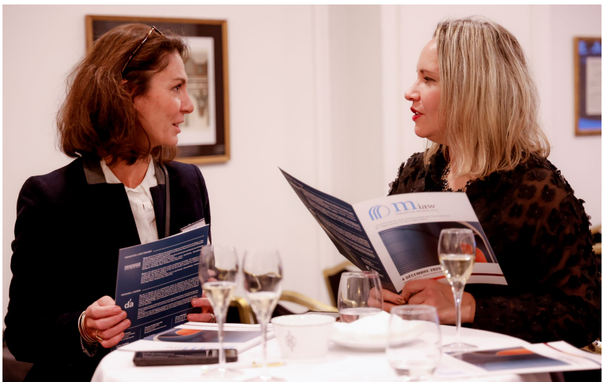
Eindrücke von der Preisverleihung